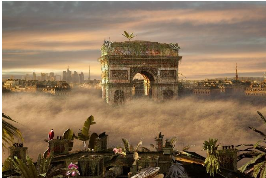
Paris Arc de Triomphe #4WhenWeWhereKings @ChrisMorinEitner

D'ici là, les œuvres présentées à l'Alternatif sont toutes proposées à la vente, dans trois formats différents (180 x 120 cm / 100 x 150 cm / 90 x 60 cm), chaque série étant limitée en tout à 7 tirages + 3 épreuves d'artiste. Samedi 9 décembre , de 14h30 à 20h00, l'artiste Chris Morin-Eitner sera présent pour une séance de dédicace du catalogue et de la boule de neige « Make Our Planet Green Again » (15 €) éditée à 400 exemplaires.