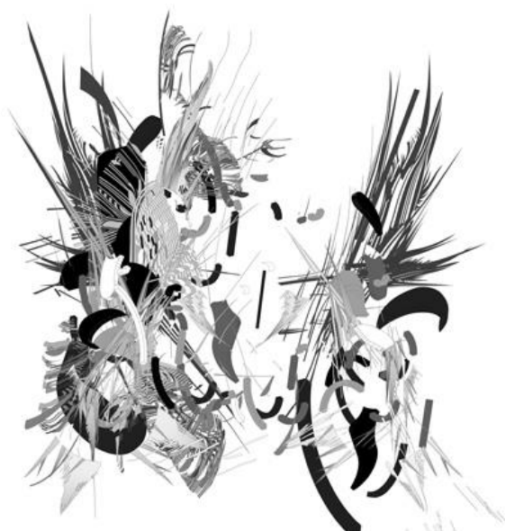
Sevan (Rodolphe Barsikian 2017)