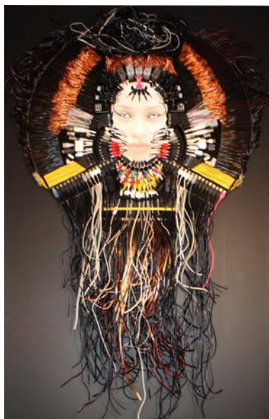
Maevak (Sacha Hailote, 2017)